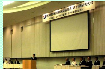
平成25年度 第31回大会の様子